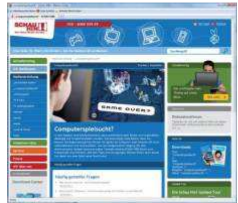
„Schau hin!“ ist eine Initiative vom Bundesministerium für Familie, Senioren, Frauen und Jugend, Vodafone, ARD, ZDF und TV Spielfilm. Die Webseite enthält auch Eltern-Informationen zu Computerspielen und Internetnutzung.