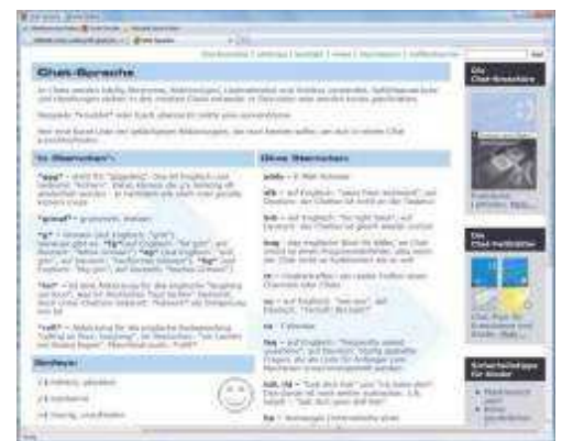
Webseiten mit Elterninfos stopfen Wissenslücken. Die Seite www.chatten-ohne-risiko.de erklärt die Gepflogenheiten beim Chat.